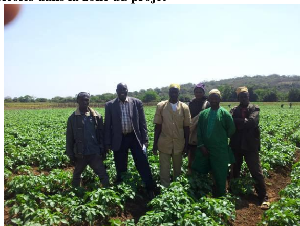
Producteurs à Soumbalako (Mamou – Guinée)