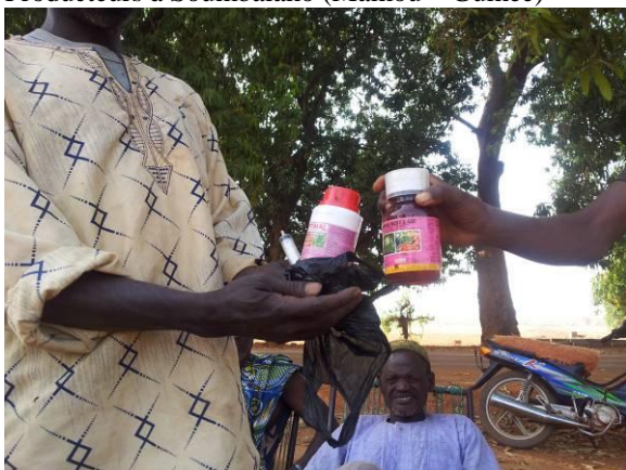
Producteurs à bafoulabé - Mali