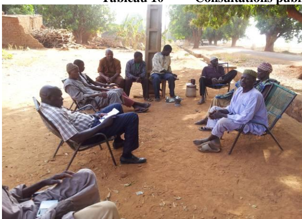
Consultation avec les producteurs à Bafoulabé- Mali