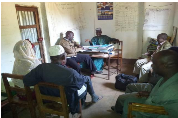
Consultation à la mairie de Dounet à Mamou - Guinée