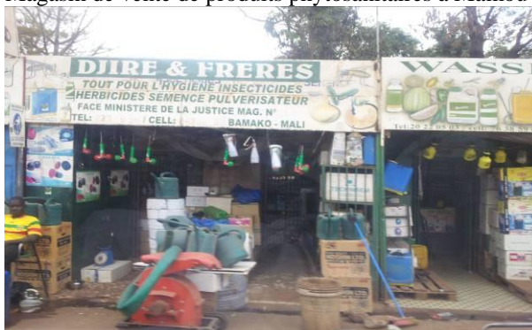
Magasin de vente à Bamako - Mali