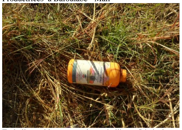
Emballage vides ans un champ à tilène - Sénégal