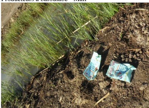
Emballage vides ans un champ à tilène - Sénégal