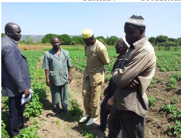
Producteurs à Soumbalako (Mamou – Guinée)