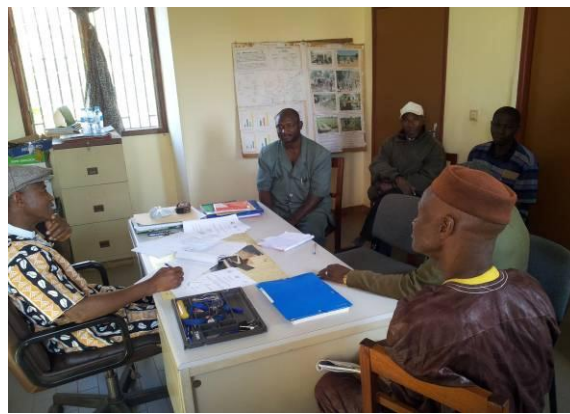
Rencontre avec l'équipe du BTGR à Mamou