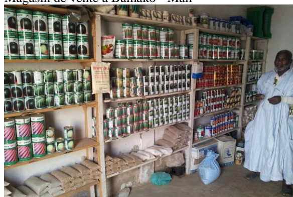
Magasin de vente à Rosso - RIM