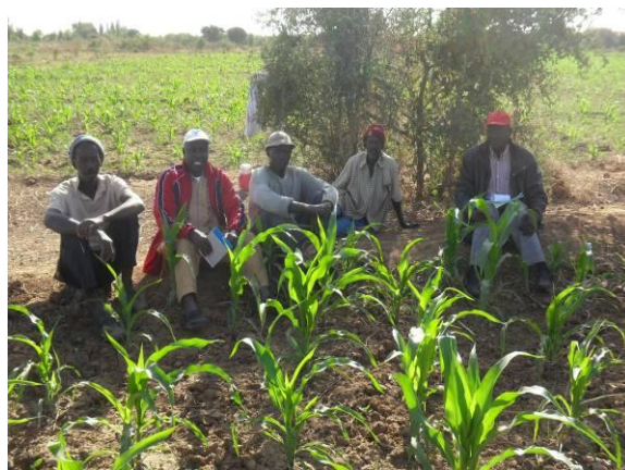
Producteur à Navel - Sénégal