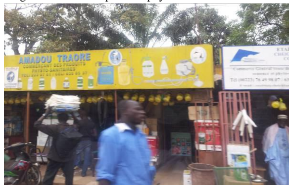
Magasin de vente à Bamako - Mali