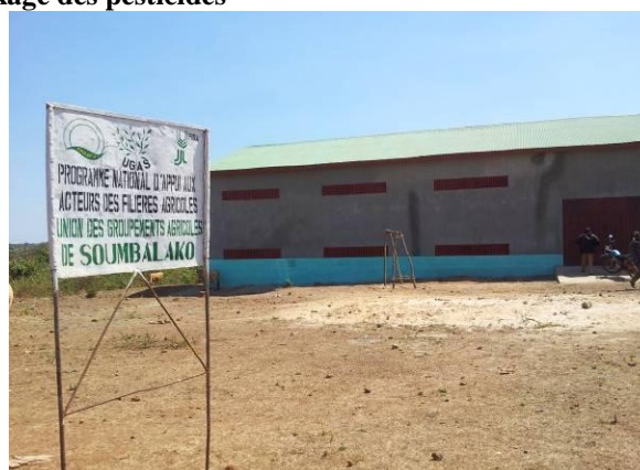
Magasin à Mamou, Guinée