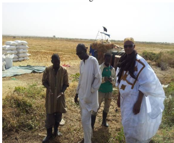
Producteur de riz – Kaédi - RIM