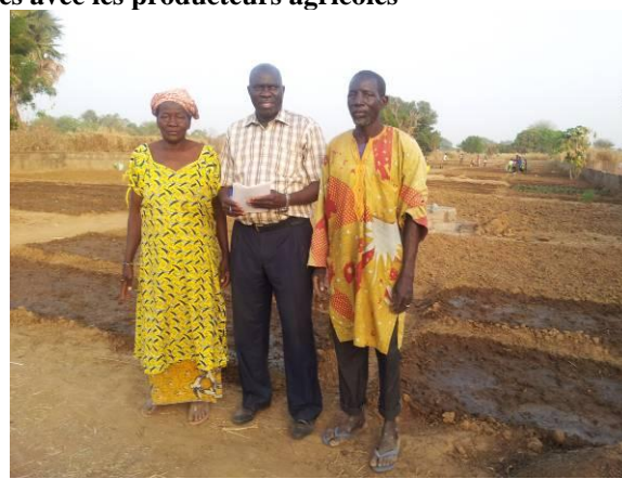
Consultation avec les producteurs à Bafoulabé- Mali