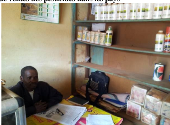
Magasin de vente de produits phytosanitaires à Mamou