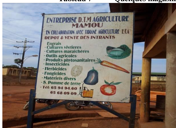
Magasin de vente de produits phytosanitaires à Mamou