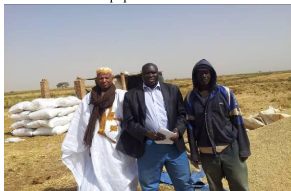
Rencontre avec producteurs de riz – Kaédi- RIM