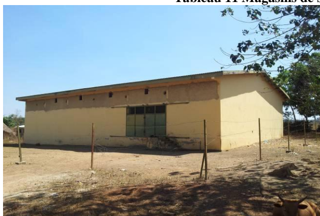
Magasin à Mamou, Guinée