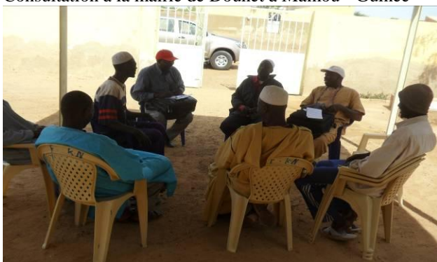
Rencontre avec un groupement à Kassak - Sénégal