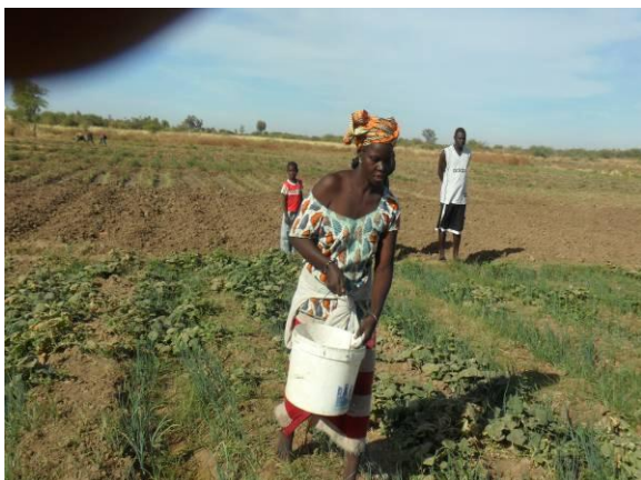
Productrice à Tilène - Sénégal