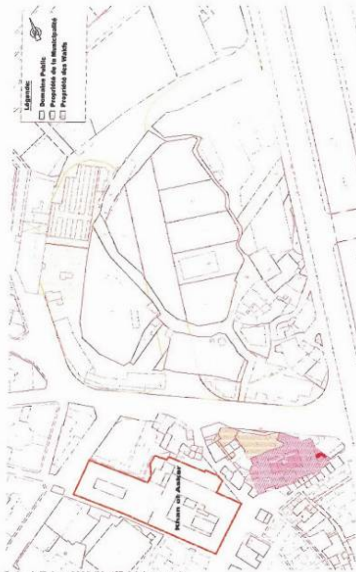
Debs & Tabet, 2002 (Unofficial document)