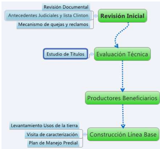
Figura 2. Diagrama del proceso de evaluación de los predios inscritos

Finalmente y tal como aparece en la figura de arriba, los ganaderos que cumplían con todos los requisitos adquirirían el estatus de beneficiarios y se iniciaba la construcción de la línea base.