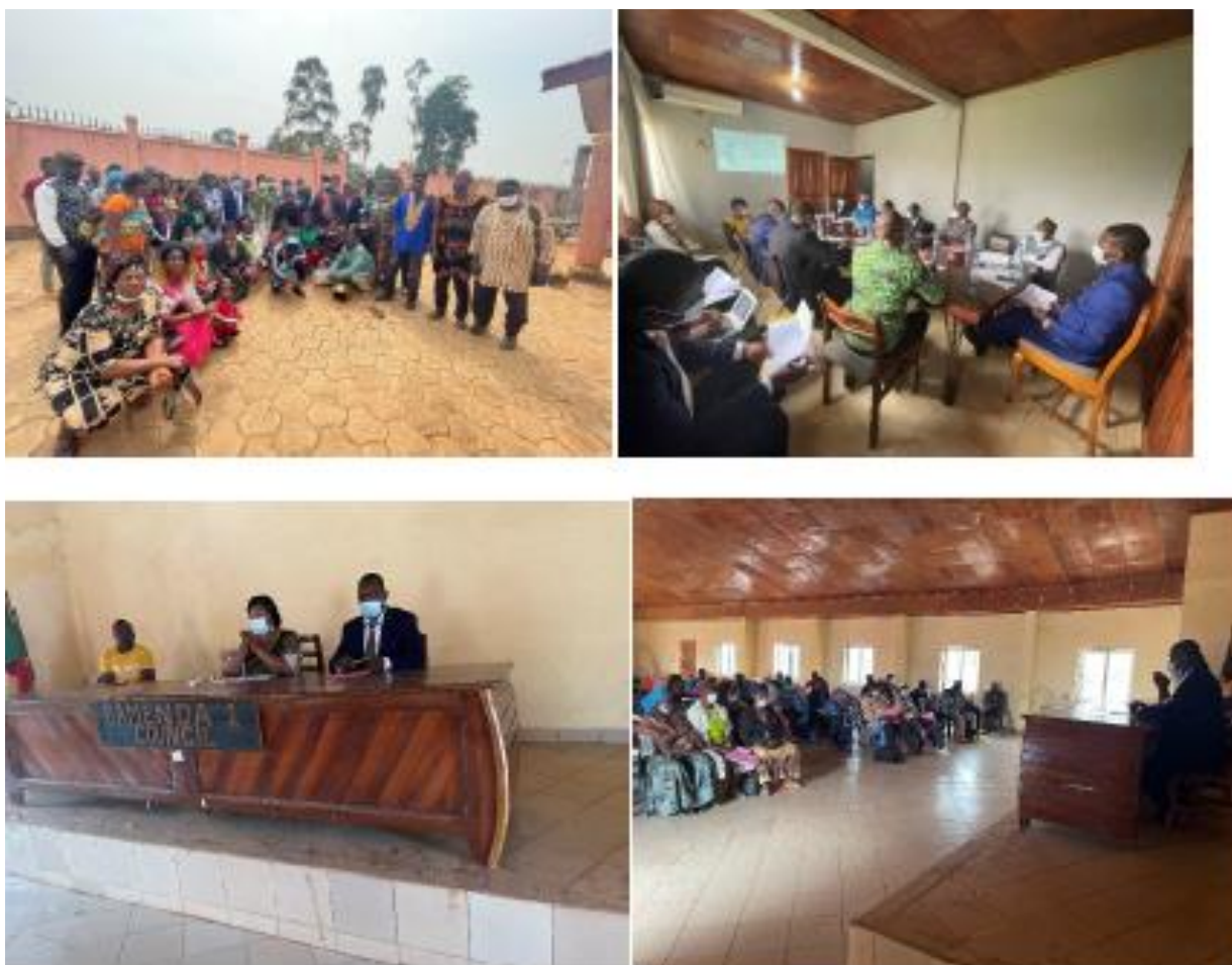
Figure 6. Photos de consultation publique à Bamenda (Région du Nord-Ouest).