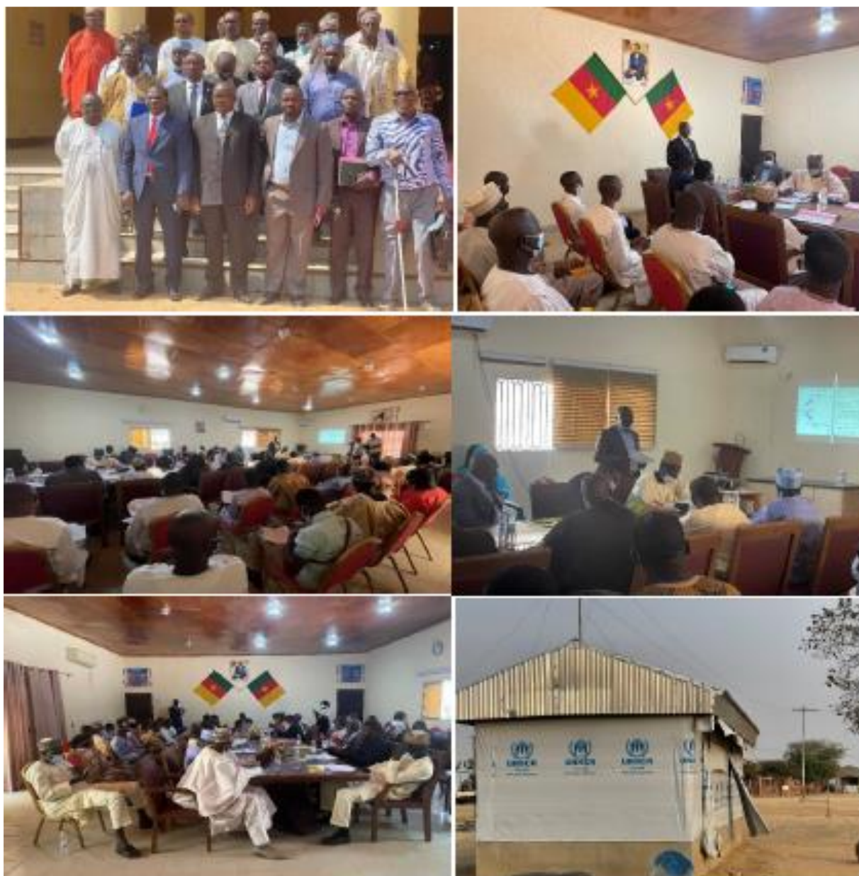
Figure 4. Photos de consultation publique à Maroua (Région de l’Extrême-Nord).