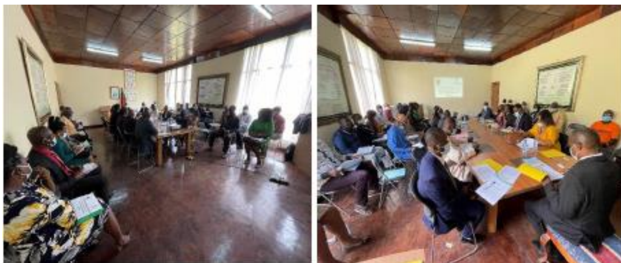
Figure 7. Photos de consultation publique à Buéa (Région du Sud-Ouest).