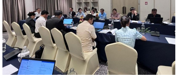
Reportage de Kaori Oshima de l'équipe de travail d'EnABLE pour l'Asie de l'Est et le Pacifique

République démocratique populaire lao. En mars 2024, l'équipe de travail a reçu la lettre de « non-objection » du gouvernement, ce qui a permis d'avancer sur le protocole d'accord en cours d'élaboration entre le Département forestier (DF) et le Centre régional de formation en foresterie communautaire (RECOFTC), l'agence de mise en œuvre proposée (voir la photo ci-dessous). Le chef de l'équipe de travail a rencontré des représentants du DF et de RECOFTC pour convenir des prochaines étapes. Des visites des villages cibles ont été planifiées pour le mois de mai.