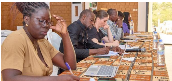
Reportage d'Alexandra Niesslein de l'équipe de travail d'EnABLE pour l'Afrique

Côte d'Ivoire. Du 25 février au 2 mars 2024, une formation approfondie a été dispensée aux points focaux de la Fédération des réseaux et associations de l'énergie, de l'environnement et du développement durable (FEREADD) dans les cinq régions couvertes par le programme de réduction des émissions du pays. L'objectif était d'améliorer la compréhension des participants sur les questions de genre et d'inclusion sociale au niveau local, ainsi que de promouvoir la sensibilisation, notamment en expliquant aux femmes la procédure d'enregistrement pour bénéficier des avantages financiers. Les ateliers se sont tenus dans les capitales administratives de chaque région concernée : Guiglo, Duekoue, Sassandra, Soubre et San Pedro. Cent vingt personnes y ont participé dans l'ensemble du pays. La formation a été animée par un représentant d'EnABLE, ainsi que par des membres de l'équipe du programme de réduction des émissions, spécialisés dans les sauvegardes et la communication. Les sessions s'adressaient aux autorités locales, aux représentants des communautés, aux organisations de la société civile, aux services administratifs locaux et aux partenaires de mise en œuvre.