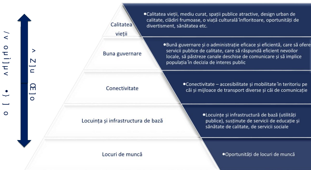
Figura 2. Piramida Nevoilor Cetățenilor

Nevoile grupurilor țintă sunt o parte importantă în formularea obiectivelor de dezvoltare. În acest context, este util să se folosească piramida lui Abraham Maslow, care conține cinci niveluri de nevoi, care pot fi folosite pentru a identifica și clasifica nevoile grupurilor țintă. Piramida lui Abraham Maslow este o structură în formă de piramidă, care este împărțită în cinci niveluri, de la cele mai de jos la cele mai de sus: