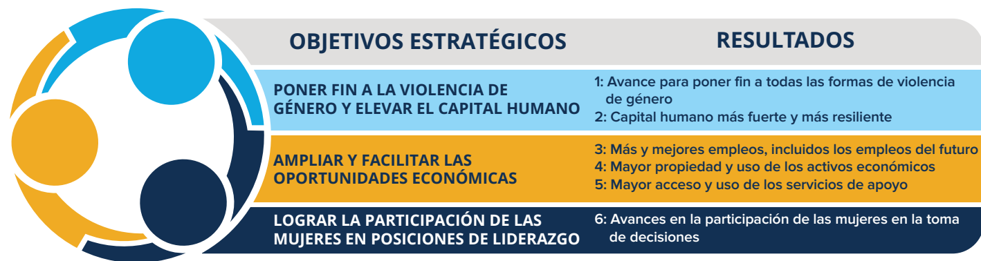
GRÁFICO 1 : OBJETIVOS ESTRATÉGICOS Y RESULTADOS DE LA ESTRATEGIA DE GÉNERO PARA 2024-2030

En su ambición, la nueva estrategia da prioridad a tres objetivos estratégicos: poner fin a la violencia de género y elevar el capital humano, ampliar y facilitar las oportunidades económicas, y lograr la participación de las mujeres en posiciones de liderazgo. Los objetivos estratégicos se medirán en función de seis resultados (gráfico 1) que reflejan tanto el valor intrínseco