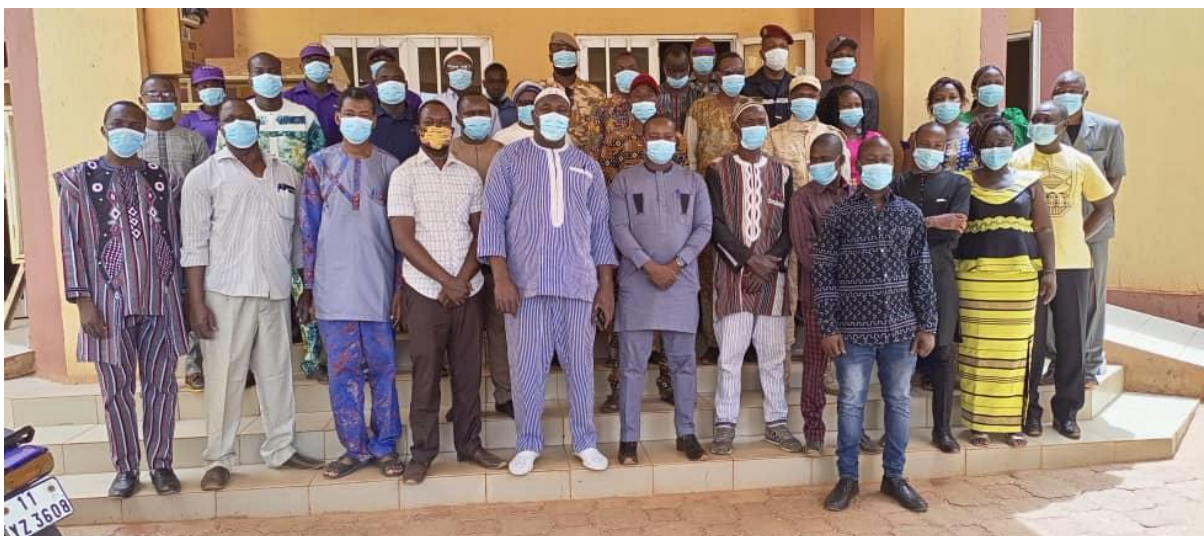
Photo 3 : Photo des participants à l'atelier communal