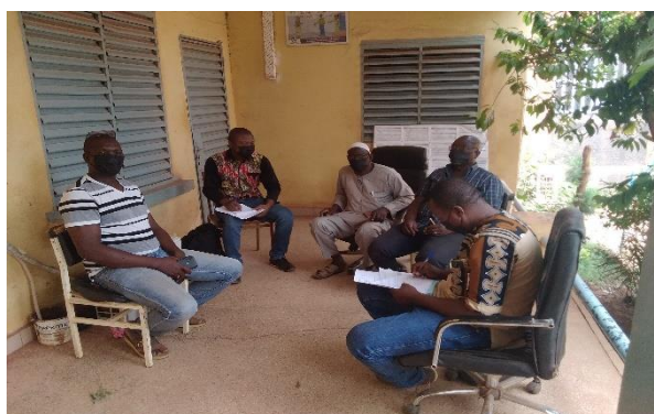
Photo 1 : Entretien avec l'Association « Zemstaaba » Photo 2 : Entretien avec la Fatière des transporteurs