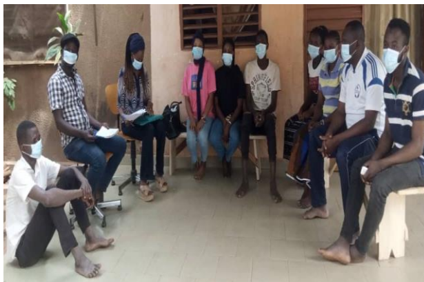
Photo 2 : Entretien avec la coordination des jeunes