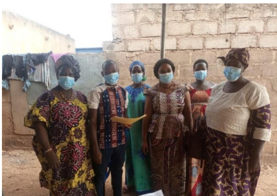
Photo 1 : Entretien avec l'Association Cri de Cœur pour le Soutien des Orphelins, des Veuves et des Démunis