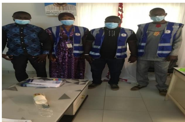
Photo 2 : Entretien avec l'Association Bon Samaritain pour l'Épanouissement de la Jeunesse