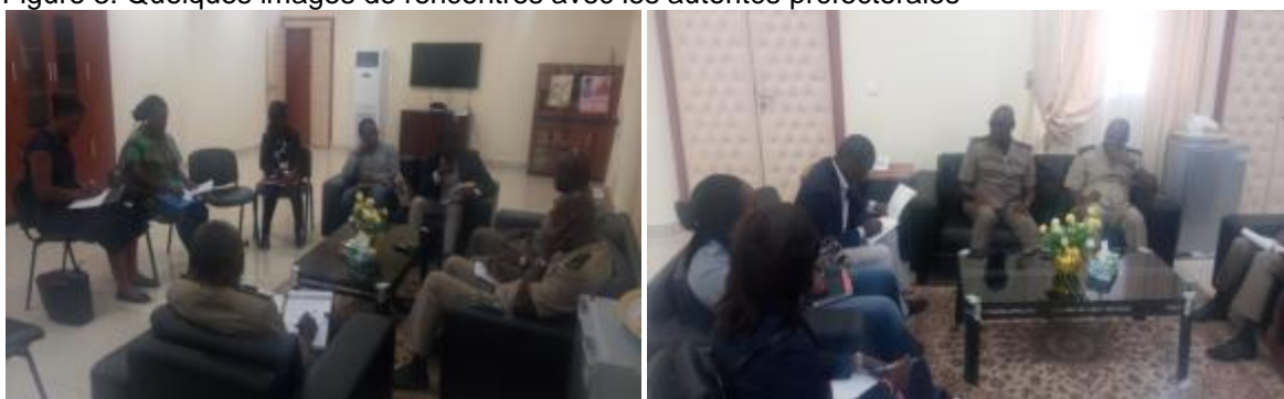
Figure 3: Quelques images de rencontres avec les autorités préfectorales

Ces différentes rencontres avaient également pour but de faciliter la collecte d'informations sur la zone du projet et le déroulement de la mission.