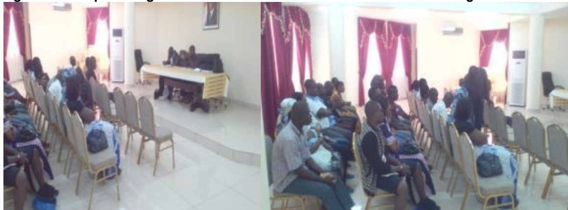
Figure 4: Quelques images de la consultation des PAPs à la Préfecture d'Agboville

Pour informer et mobiliser la population, le consultant a eu l'assistance du Service Technique de la Mairie.