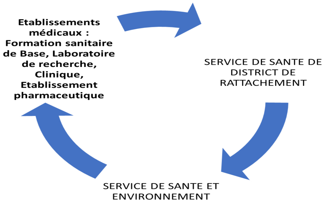
Figure n°2 : Circuits de collecte des données