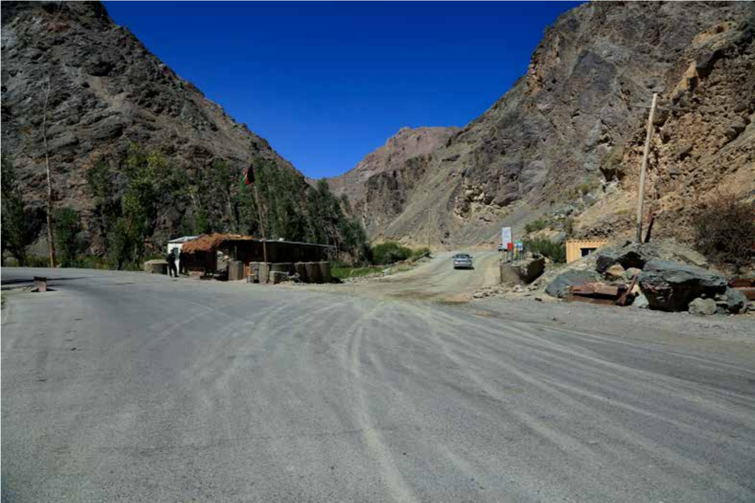
جوامع که در مناطق دور افتاده کوه های

طراحی اولیه کار بازی سازی تونل سالنگ طبق پلان پروژه پیشرفته است، اما یافته ها اولیه نشان می دهد که