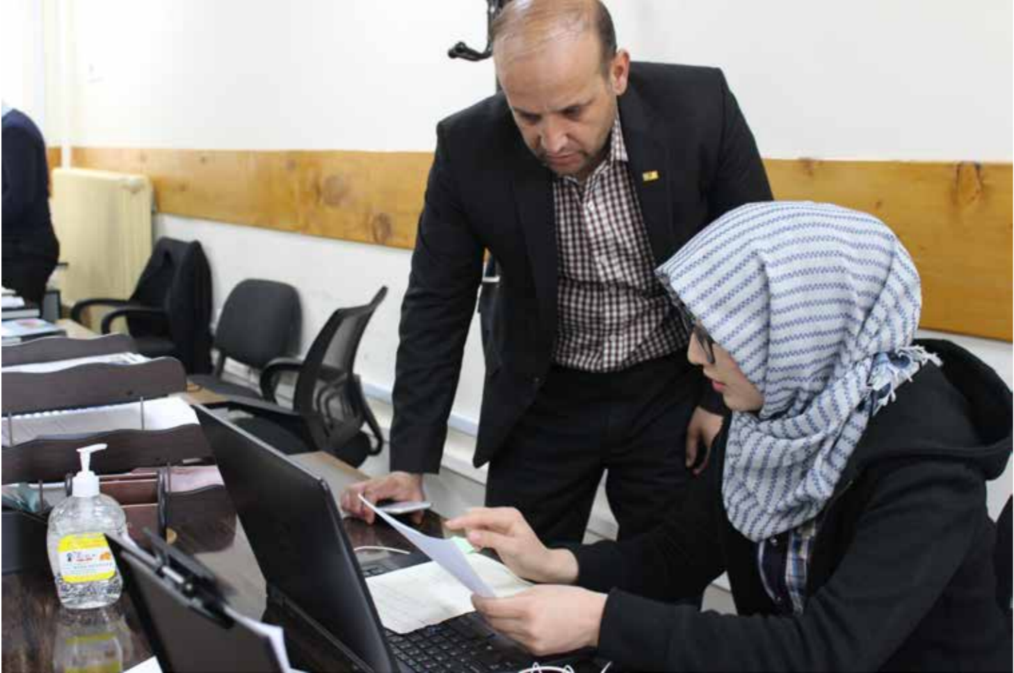
پروژه حمایت به خاطر بهبود امور مالی در شرایط حساس تلاش های دولت افغانستان را در راستای تقویت مدیریت امور مالی، انکشاف زمینه های جمع آوری عواید و دستیابی به خودکفایی اقتصادی حمایت می نماید. اولویت این پروژه تقویت و نگهداری ظرفیت ها، به ویژه ظرفیت های زنان، میباشد. برای شناسایی و ظرفیت سازی زنان برنامه های گسترده در وزارت مالیه ایجاد گردیده است.

(ج) ظرفیت اداری و مدیریت اجراءت: به عنوان بخشی از تلاش های دولت جمهوری اسلامی افغانستان در راستای تطبیق اجندای اولویت تشکیل "Tashkeel first"، سلسله از کمک های ملی تخنیکی در سطح تمام ادارات مورد حمایت پروژه حمایت به منظور بهبود امور مالی (وزارت مالیه؛ اداره ملی تدارکات و اداره عالی تفتیش) آغاز گردیده است. وزارت مالیه به طور خاص پیشرفت قابل ملاحظه ی را در زمینه استفاده مطلوب از کمک های تخنیکی این پروژه بدست آورده است و میزان استفاده وزارت مالیه از این کمک ها بالغ بر ۵۳ درصد می باشد. محور کمک های تخنیکی پروژه حمایت به منظور بهبود امورمالی