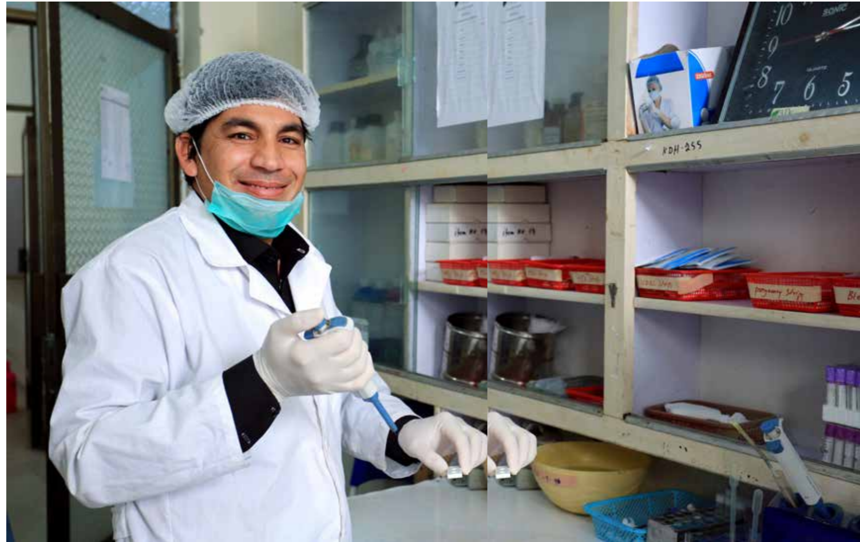
به کمک پروژه های صحتی، مانند پروژه صحتمندی، تعداد مراکز و کلینیک های صحتی در افغانستان به مقایسه سال ۲۰۰۲ میلادی چهار مرتبه افزایش یافته است. اهداف پروژه صحتمندی بهبود عرضه خدمات صحتی، تقویت سیستم صحتی و افزایش دسترسی به مراقبت های صحتی، و افزایش تقاضا و مسوولیت پذیری جامعه برای خدمات اساسی صحتی می باشد.

علی الرغم پیشرفت های قابل ملاحظه در میزان و کیفیت خدمات صحتی و هم چنان کاهش در سطح مرگ و میر مادران، اطفال زیر سن پنج سال و اطفال نوزاد، شاخص های صحت در افغانستان هنوز پائین تر از حد اوسط قرار دارد که برای کشور های دارای عواید پائین