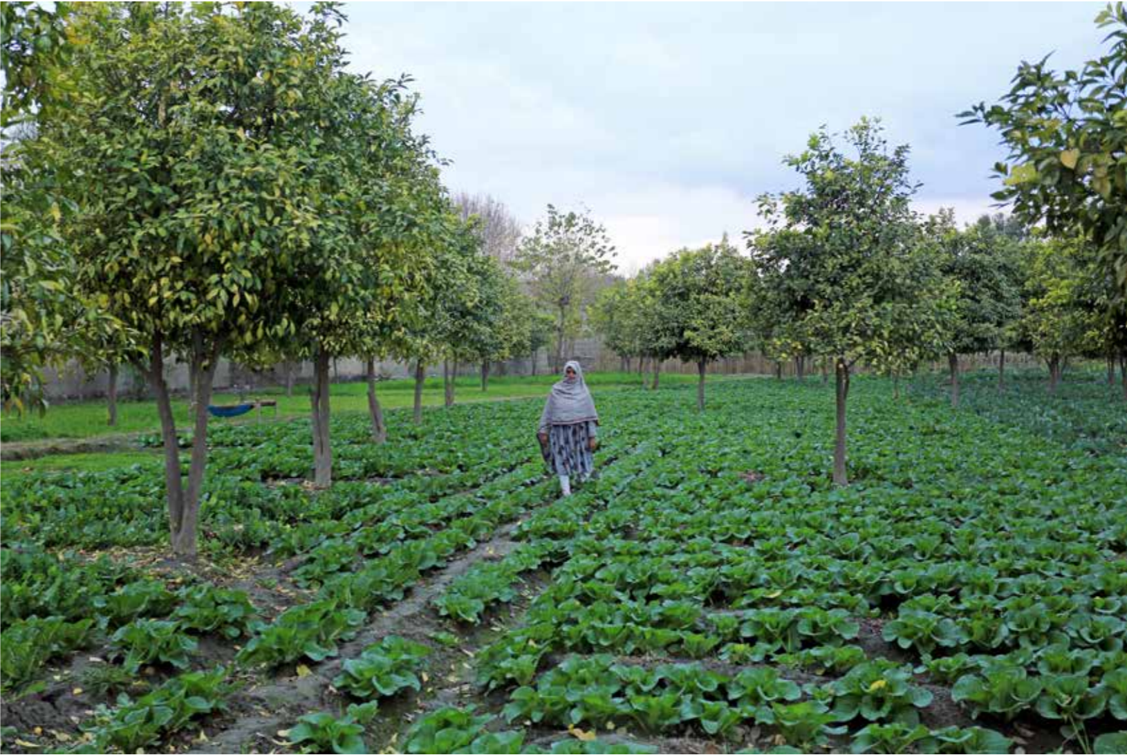
اداره بین المللی مالی انکشاف صادرات محصولات باغداری افغانستان را از طریق معرفی روش های موثر بازاریابی برای دهاقین و فراهم سازی فرصت های دسترسی آنها به بازارهای داخلی و بینالمللی را تقویت میکند.