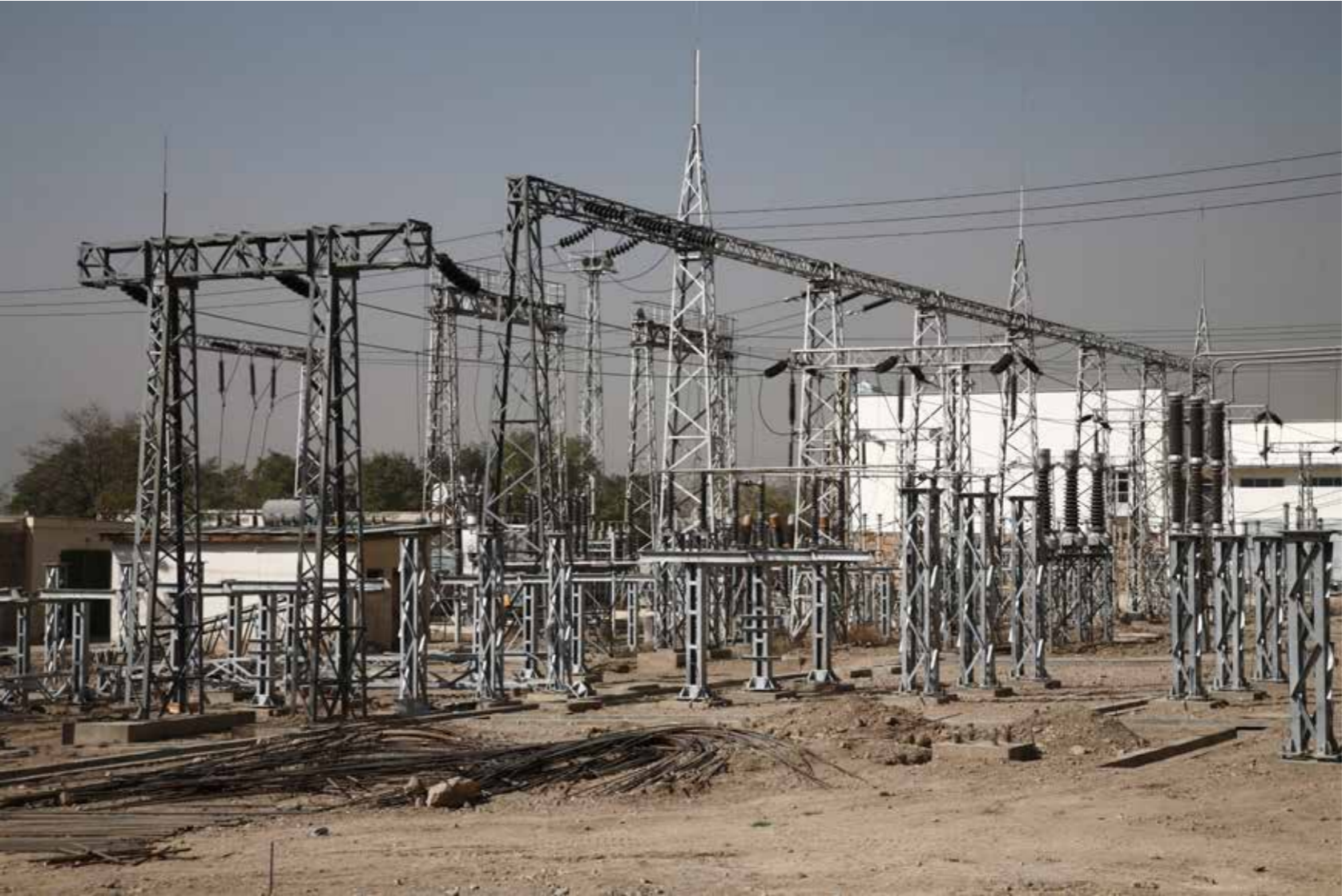
پروژه انتقال برق از آسیای مرکزی به جنوب