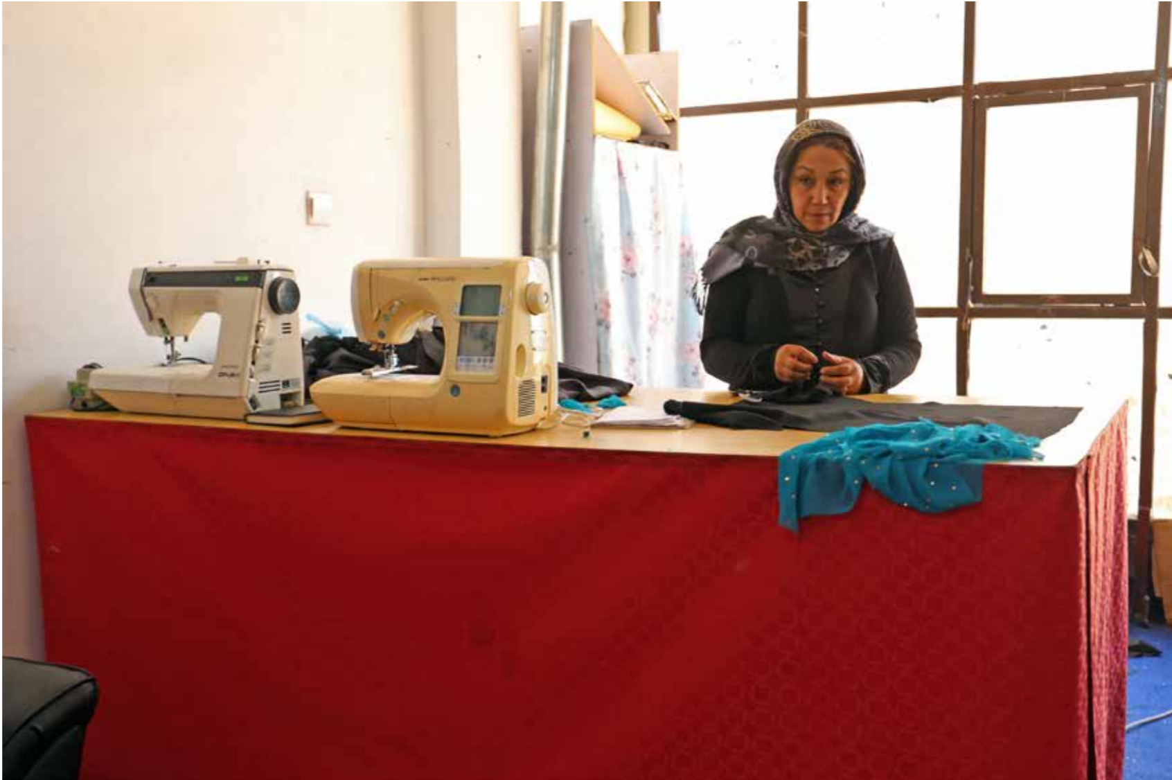
زنان مناطق روستایی و نیمه شهری از

به منظور ساده سازی، تقویت و توانمند سازی ساختار های اداری تعلیمات مسلکی و تخنیکی، بخاطر بهبود و انکشاف کارایی مکاتب و انستیتوت های تعلیمات مسلکی و تخنیکی وهمچنان بهبود ظرفیت های رقابتی، دولت افغانستان طی فرمان شماره ۱۱، مؤرخ ۲۱ اپریل سال ۲۰۱۸ ریاست جمهوری اقدام به ایجاد اداره مستقل تعلیمات مسلکی و تخنیکی (TVETA) نمود. به این