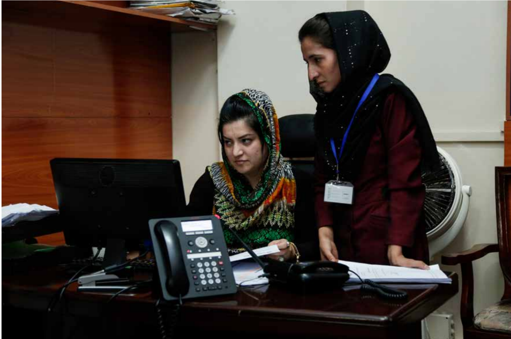
برای تعداد بیشتری از زنان فرصت کار در وزارتخانه های دولتی از طریق برنامه ارتقای ظرفیت مبتنی بر نتایج افغانستان فراهم گردیده است. این برنامه دولت افغانستان را در راستای انکشاف منابع بشری، ساختار های اداری و بهبود عرضه خدمات به مردم حمایت کرد.

هدف حمایت از پلانگذاری و ارتقای ظرفیت د افغانستان برشنا شرکت ارتقای ظرفیت این اداره غرض توزیع سرمایه گذاری و پلانگذاری، تطبیق و اجرا و حفظ ومراقبت اموارت محوله میباشد.