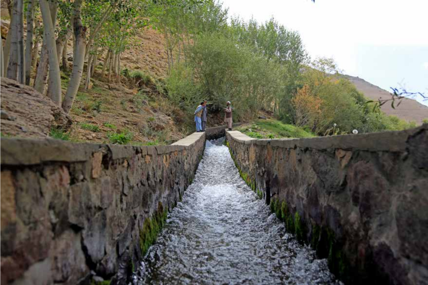
در مجموع ۱۸۵ سیستم های منظم آبیاری

فشردهٔ پیشرفت های کنونی در زمینه عبارت اند از: طرح ماستر پلان حوزه دریایی پنج - آمو تصویب گردیده است، پالیسی مرزی به کابینه ارائه شده است، تمام نظریات و پیشنهادات گنجانیده شده است، و در حال نهایی شدن قرار دارد. لایحه وظایف برای حفر چاه های امتحانی و سروی جیوفیزیکی برای هفت شهر (فراه ، هرات، جلال آباد، کابل، کندهار، مزار شریف و زرنج) تکمیل گردیده و استخدام کمپنی قراردادی که اجرای پروژه را در کابل برعهده میگیرد، در جریان است. نقشه های مقدماتی