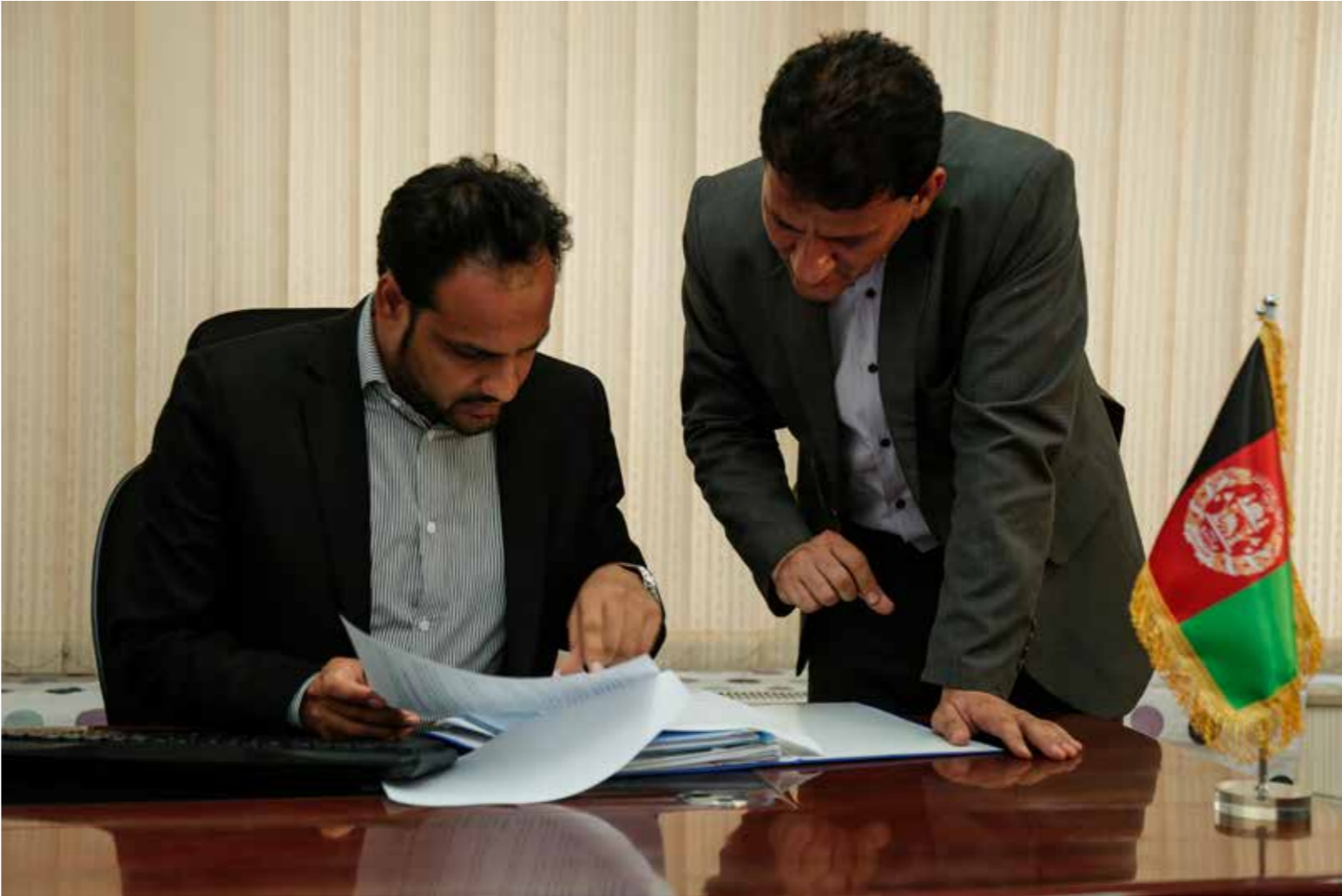
پروژۀ پاسخ سریع جهت بهبود وضعیت