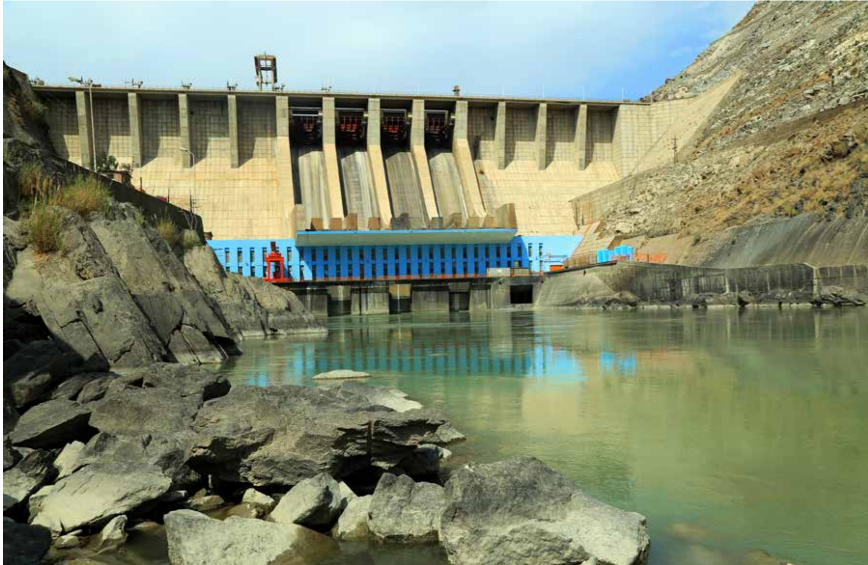
فابریکه برق آبی نغلو بعد از احیاء و بازسازی دو توربین توسط پروژه انکشاف بند برق آبی نغلو با ظرفیت تولیدی اعظمی تولید برق را آغاز نمود. تعدادی زیادی از روستاهای اطراف و نواحی مجاور این بند از سب استیشن جدید که به کمک این پروژه ایجاد گردیده به برق دسترسی حاصل خواهد نمود.