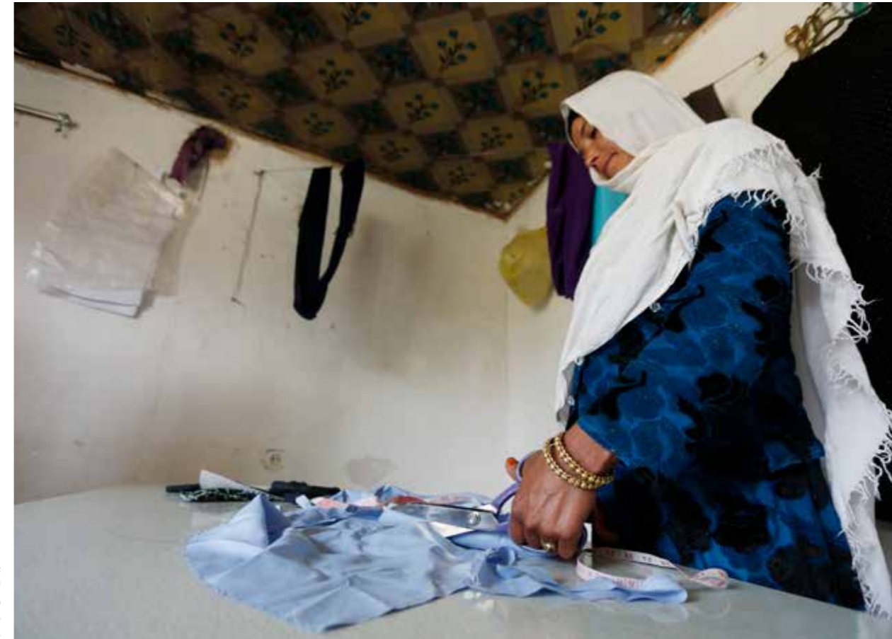
پروگرام توانمند سازی اقتصادی زنان داری اولویت ملی، دسترسی زنان افغان را به منابع و فرصت‌های اقتصادی بلند میبرد که در نتیجه سبب خودکفایی زنان و بهبود جایگاه شان در جامعه می‌گردد.