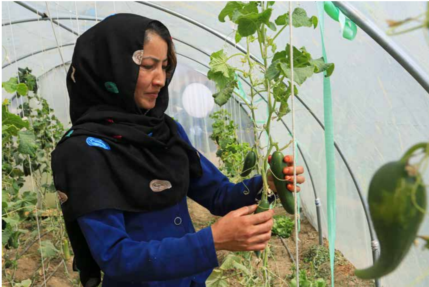
انتظار میرود که زنان در مناطق روستایی از خدمات پروژه توانمند سازی اقتصادی و انکشاف روستایی زنان بیشتر مستفید شوند. این پروژه به هدف افزایش توانمندی های اجتماعی و اقتصادی زنان روستایی در حدود ۷۶ ولسوالی به تعداد مجموعی ۵۰۰۰ قریه را در سراسر افغانستان تحت پوشش قرار میدهد.

در مناطق شهری: پروسه شناسایی بیشتر از ۸۴۰۰ گروه اجتماعی آسیب پذیر تکمیل گردیده است، بیشتر از ۸۱۵۰ شورای انکشافی محلی شهری انتخاب، بیشتر از ۶۹۰۰ طرح های انکشافی محلی تکمیل و بیشتر از ۵۷۰۰ درخواست برای پروژه های فرعی دریافت گردیده است. در مناطق روستایی: تطبیق این برنامه هم اکنون در بیشتر از ۶۶۰۰ محلات روستایی جریان دارد. بیشتر از ۶۳۳ شورای انکشافی محلی قریه توسط باشندگان محلات انتخاب، بیشتر از ۵۹۲ طرح های انکشافی محلی تکمیل و ۵۰۹ درخواست برای پروژه های فرعی تأیید گردیده است. در مجموع، قبلاً عضویت ۹۰ فیصد شورا های انکشافی محلی به شمول اعضای جدید در ساحات تحت پوشش برنامه همبستگی ملی (بطور مثال، انهای که هیچوقت در شورا های انکشافی محلی فعالیت نداشته اند) و نزدیک به نصف (در مجموع ۴۷ فیصد و ۴۸ فیصد کارمندان دفتر) را زنان تشکیل میداد. این شواهد نشان میدهند که سیستم جدید انتخابات و نورم های اداره شورای انکشافی محلی دارای تأثیرات قوی بوده اند.