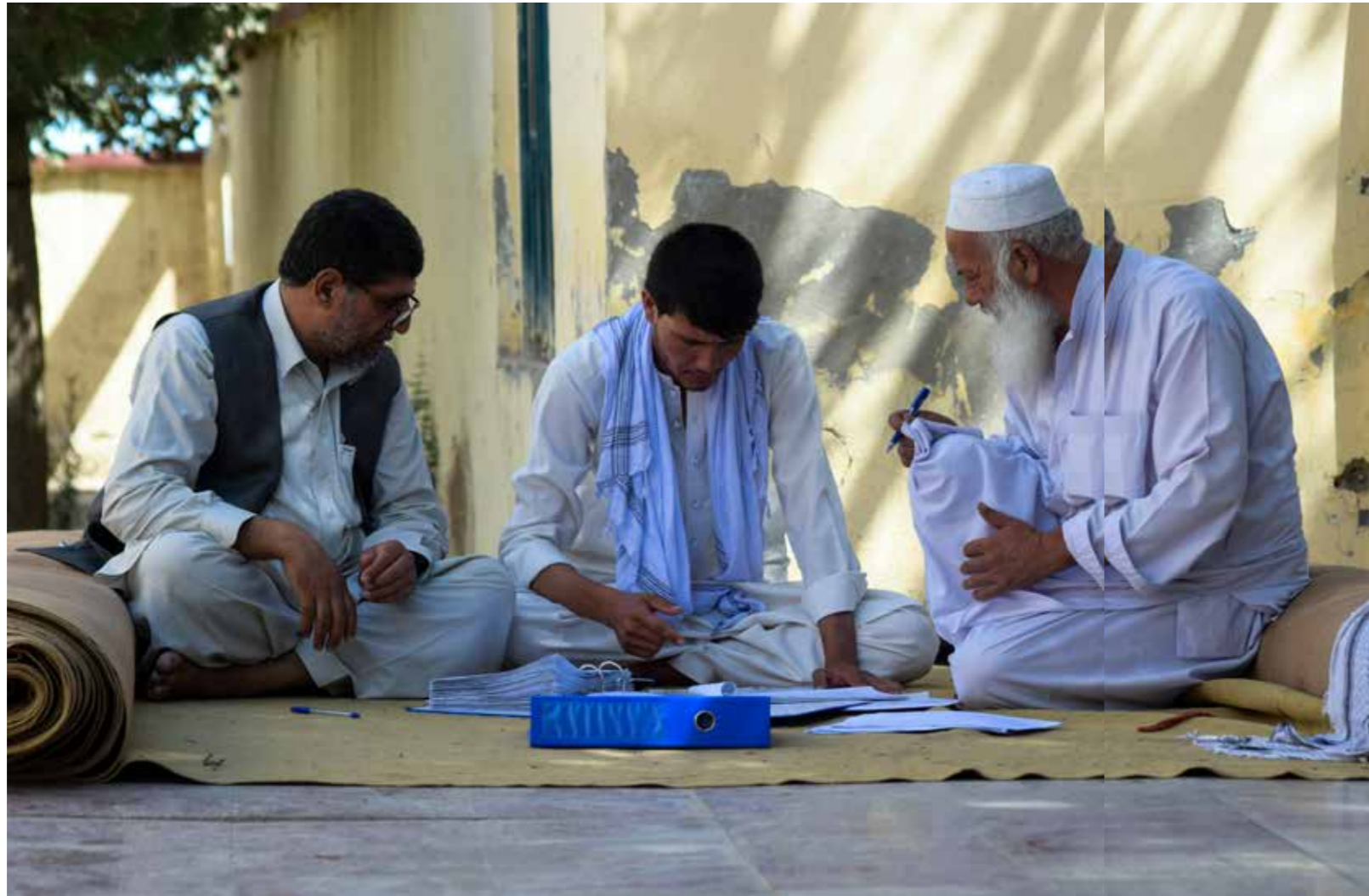
در زندگی هزاران جامعه ساکن روستا های کشور از طریق شورا های تقویت شده انکشافی محلی، که تحت چارچوب برنامه ملی میثاق شهروندی فعالیت میکنند، تحول قابل ملاحظه ی دیده میشود. رییس یک شورای انکشافی محلی میگوید: "در ساحاتی که ما تحت پوشش قرار دادیم، اعتماد مردم به دولت نسبت به گذشته بیشتر گردیده و حتی اکنون آنها در کار های انکشافی نیز سهم فعالانه میگیرند."