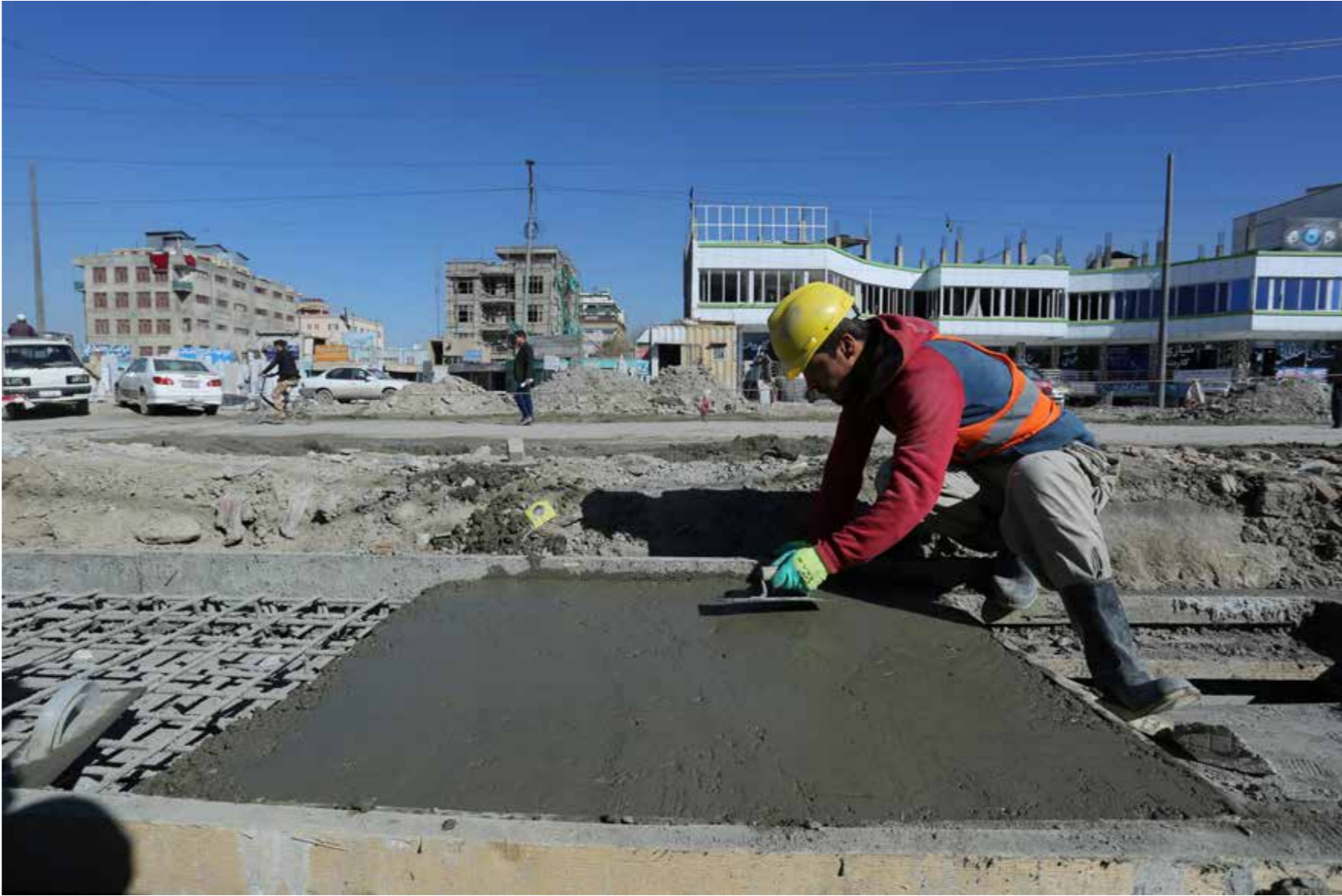
بازسازی این سرک عمومی در شهر کابل، که قبلاً در وضعیت بسیار بدی قرار داشت، موجب سهولت جریان ترافیک و دسترسی آسان باشندگان و دوکانداران محلی به شهر خواهد شد. بازسازی این سرک، که احیای آبرو ها و نصب چراغ های کنار جاده را نیز در بر خواهد میگيرد، توسط پروژه بهبود موثریت ترانسپورت شهری کابل تطبیق میشود. یکی از باشندگان محل، که خوش به نظر میرسد، میگوید، "بازسازی این جاده بزرگترین هدیه برای مردم، که در این منطقه زندگی و کار میکنند، خواهد بود."

وزارت تحصیلات عالی یک پالیسی و مقرره روش اموختن از طریق انترنت (انلاین) را انکشاف داده است. این عمل باعث معرفی تدریجی آموزش های مختلط، جا دادن اموختن از طریق انترنت (انلاین) در نصاب پوهنتون و همچنان به رسمیت شناختن آموزش های مختلط در کزیدت ها گردیده است. در مرحله آزمایشی، یک تعداد برنامه های آموزشی آنلاین به گونه انتخابی در وب سایت بنام AfghanEx اپلود گردیده و قرار است که در شماری پوهنتون های دولتی تدریس گردند. وبسایت AfghanEx در مطابقت با اساسات EdEx به منظور