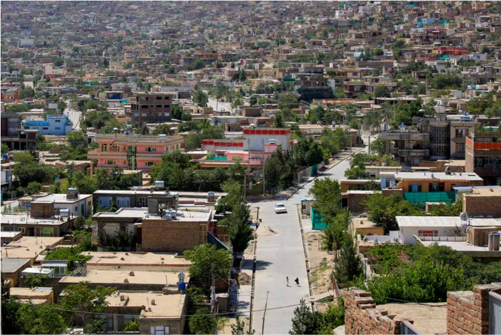
تأمین حمایت مالی به منظور تقویت پلان های انکشاف شهری، ارائه خدمات اساسی و بهبود مدیریت در مراکز پنج شهر بزرگ توسط پروژه حمایت انکشاف شهری در نظر گرفته شده است. این پروژه همچنان برای بهبود ظرفیت پالیسی سازی شهری در سطح ملی فعالیت خواهد کرد.

بخش چهارم: سرمایه گذاری شهری: انجام مطالعات امکان پذیری به منظور طرح و دیزاین زیربنا های شهری. تهیه پلان های سرمایه گذاری چندین ساله در مطابقت با پلان انکشاف ستراتیژیک شهری برای مراکز پنج شهر بزرگ که تطبیق پروژه های دارای اولویت (پروژه های محاسبه شده و با قابل تطبیق) و از قبل تعریف شده (تحت پلان انکشاف ستراتیژیک شهری و پروژه های اقتصادی قابل انتقال تشخیص شده باشند) در آن امکان پذیر باشد. پلانهای سرمایه گذاری همچنان به منظور انکشاف پروژه های شهری مطلوب برای جذب حمایت بانکهای خصوصی به منظور همویل مالی آنان از پروژه های شهرسازی مبتنی بر چگونگی انکشافات این سکتور در آینده، استفاده خواهند شد.