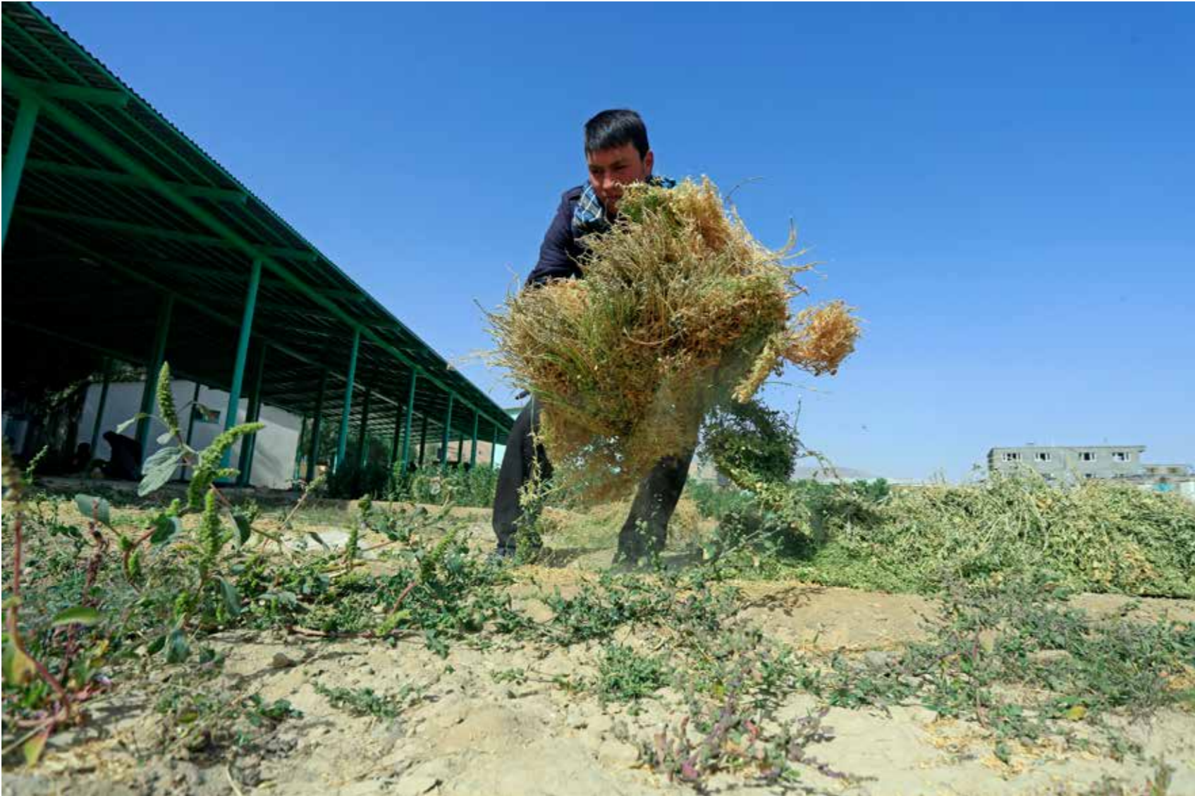
موثریت مزرعه های تحقیقاتی از طریق

بیشتر از ۵۰۰ کیلومتر کانال آبیاری (۱۸۶ کیلومتر مطابق پلان) که حدودا ۵۸۰۰۰ هکتار زمین را تحت پوشش قرار میدهد احیاء و بازسازی گردیده و همزمان با این ۶۱۴ اتحادیه های آبیاری (۵۰۰ اتحادیه مطابق پلان) تاسیس شده اند. فعالیت های هموار کاری زمین به هدف