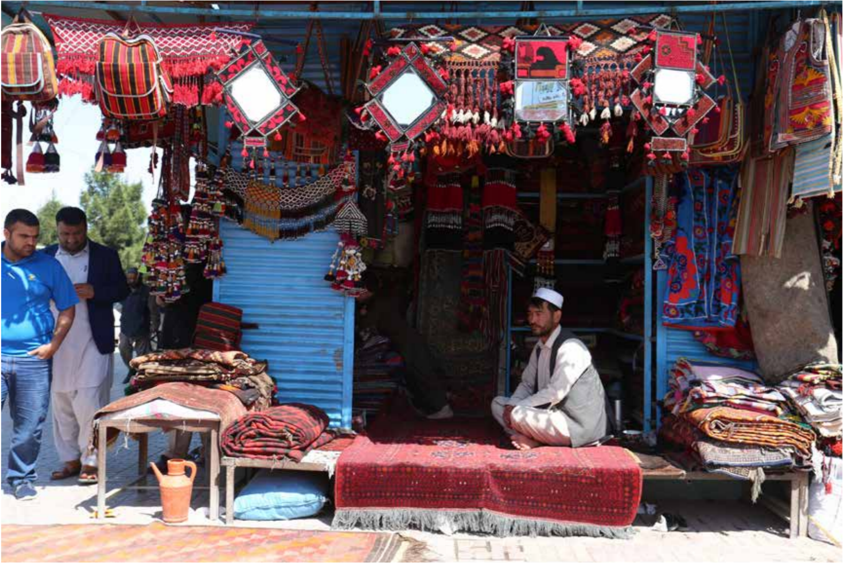
تشبثات خصوصی کوچک، مانند این کارخانه کوچک تولید و فروش قالین، به کمک پروژه دسترسی به خدمات مالی توانسته اند تا کاروبار شان را رونق بدهند. این پروژه نوآوری های متشبین کوچک را غرض دسترسی و استفاده از خدمات مالی تشویق میکند.

قرار است که یک سروی به منظور بررسی و ارزیابی تأثیرات پروژهء کمک به مردم بی نهایت فقیر و بی بضاعت در آئعده از محلات تحت فعالیت برنامه صورت