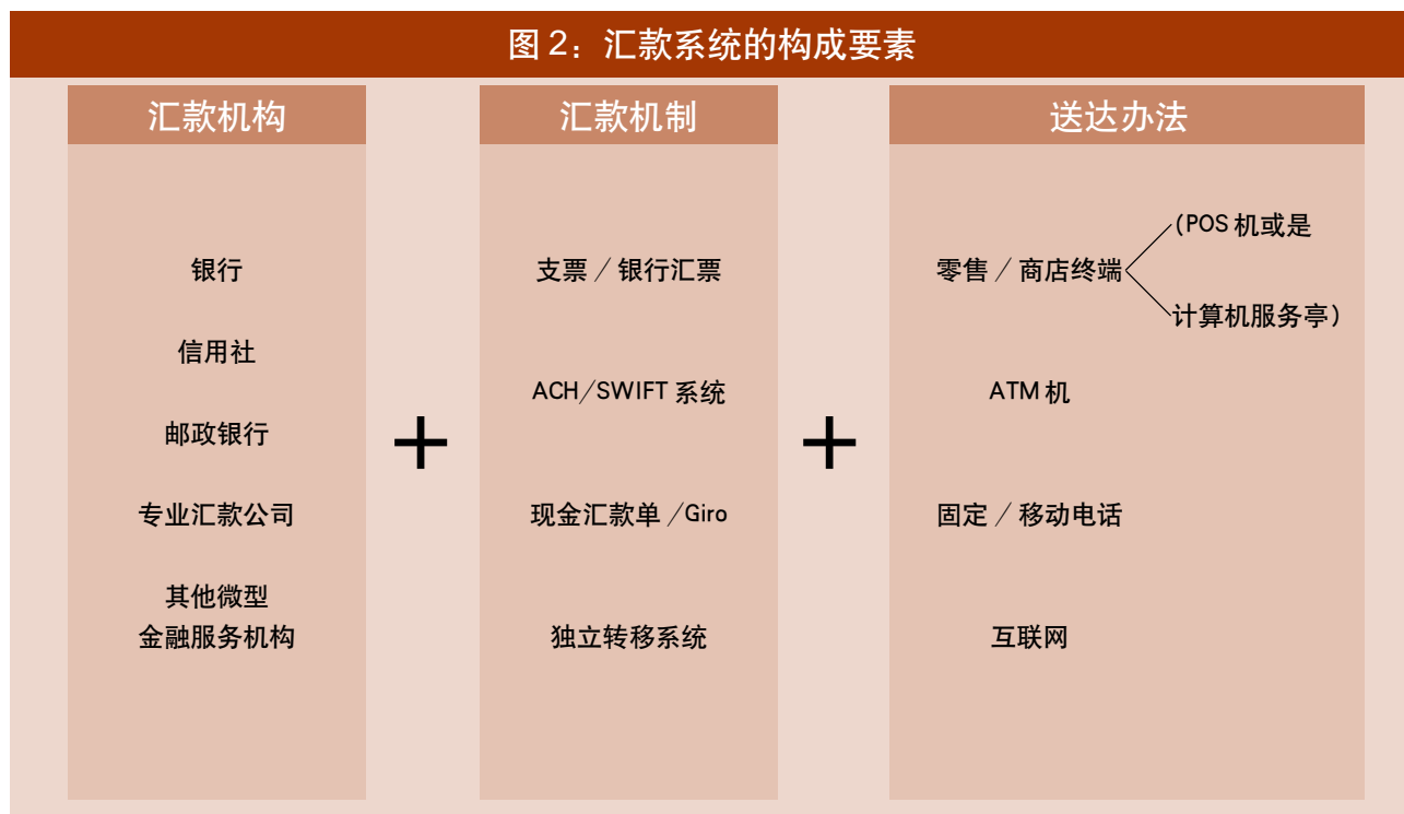
图 2: 汇款系统的构成要素