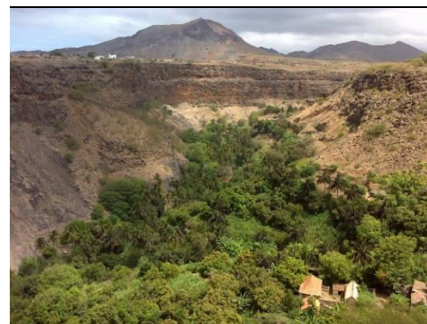
Ilustrações 3: Caminho vicinal do Vale da Ribeira Grande de Santiago, a ser reabilitado no âmbito do projeto "Requalificação Ambiental e Urbana de Cidade Velha, Património Mundial".