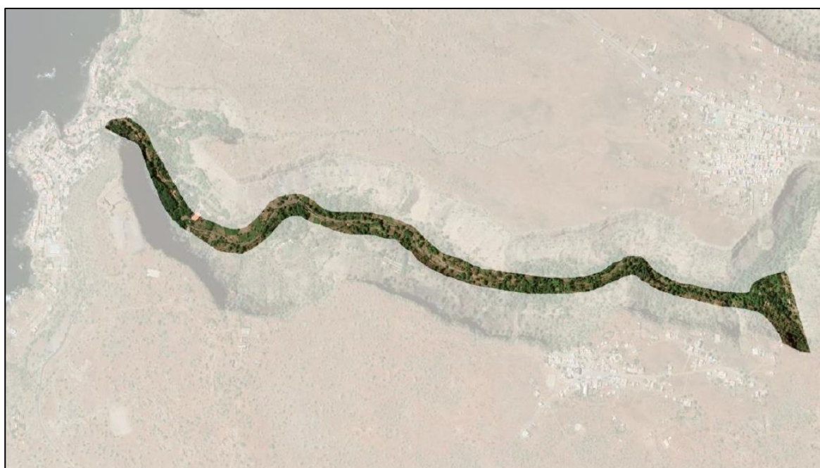
Ilustrações 1 - Área de intervenção do projeto, Vale da Ribeira Grande de Santiago, Cidade Velha.

A conceção deste PGAS e sua implementação durante as intervenções planeadas garantem que medidas de prevenção, redução e compensação sejam implementadas para eliminar ou neutralizar os impactes sociais e ambientais adversos sobre as pessoas o ambiente e as